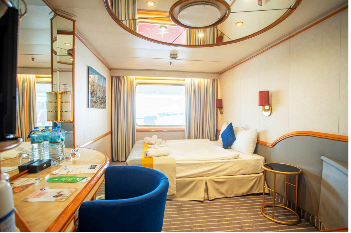
(CAT7) Junior Suite Kısmi GörüŖlü DıŖ Kabin