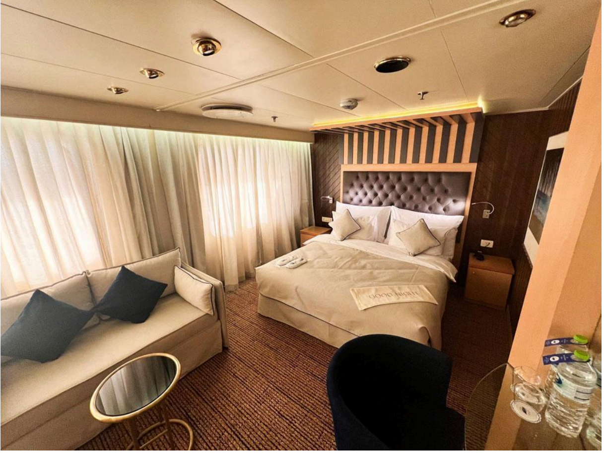
(CAT10) Balkonlu Suit Kabin