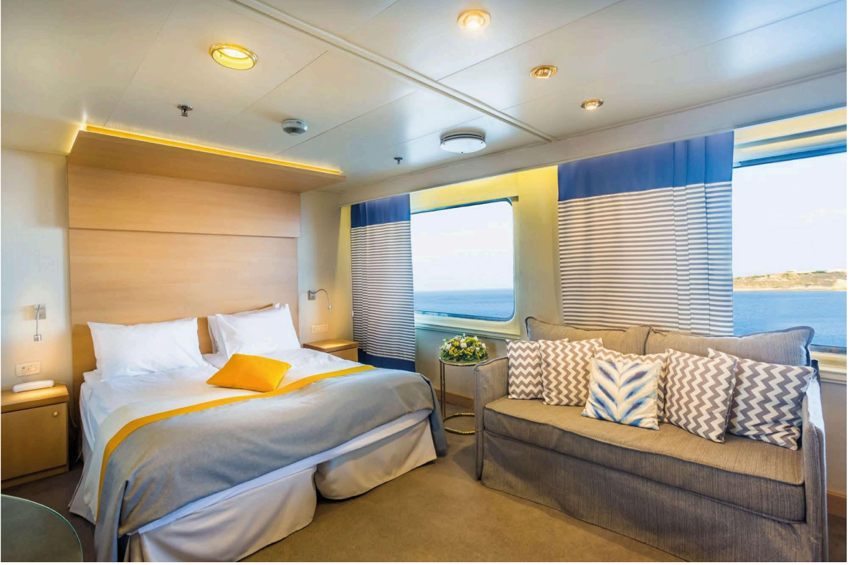
(CAT9) Junior Suit Kabin