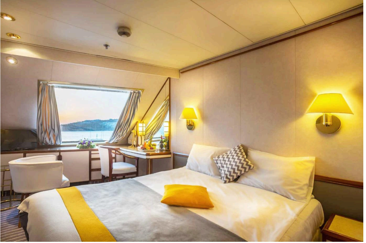
(CAT8) Deluxe Suit Kabin