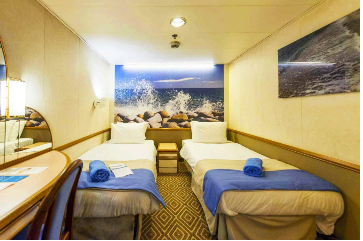
(CAT2) Standart İ Kabin