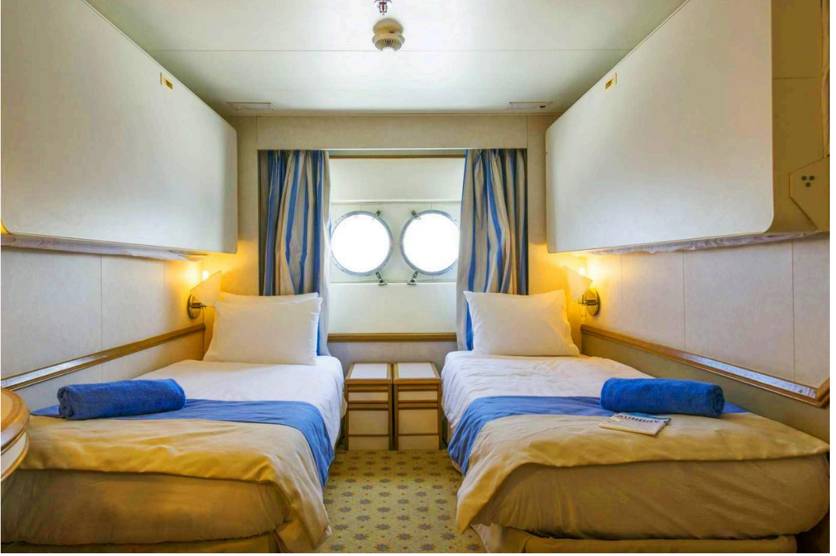
(CAT4) Standart Dış Kabin