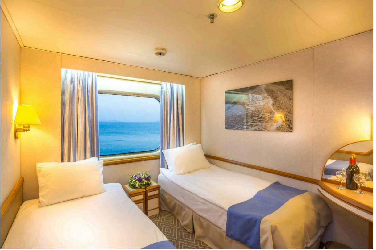
(CAT6) Superior Dış Kabin